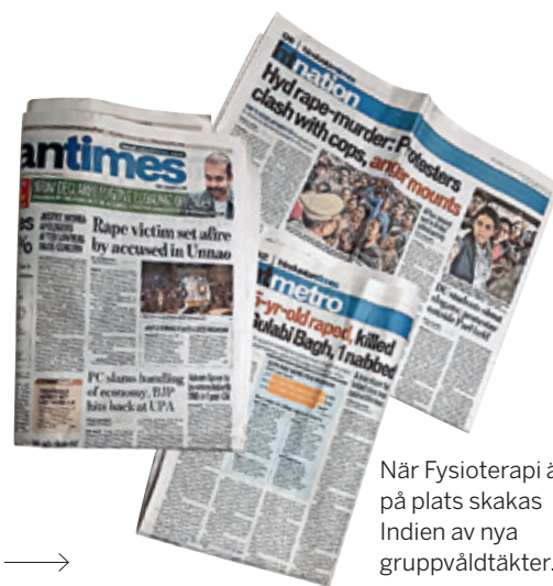
När Fysioterapi är på plats skakas Indien av nya gruppvåldtäkter.

När hon så småningom själv utsattes för diskriminering på jobbet förblev hon tyst. Det började när hennes första son skulle födas. Då var hon sedan flera år